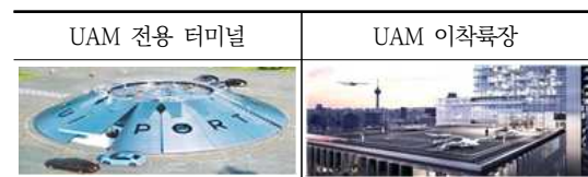
Fig. 4. UAM terminals and vertiport designs