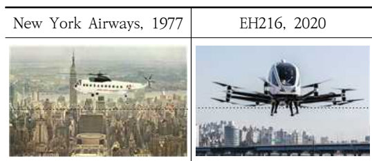
Fig. 1. Comparison of 1960-era UAM operations and current UAM concepts

현행 「비행장시설 설치기준」은 육상 헬기장, 수상 헬기장, 옥상 헬기장, 해상구조물 헬기장으로 분류하고 있으며, '육상헬기장'의 경우 활주로, 착륙대, 개방구역, 착륙구역, 유도로, 주기장 및 활주로의 최소 이격거리를 규정하고 있고, '옥상헬기장'은 활주로, 착륙대, 개방구역, 착륙구역, 유도로, 주기장, 안전계단 등, 연료유출 방지시설, 보안시설, 회전익항공기 탈락방지시설을 규정하고 있다. 그리고 국제민간항공기구(ICAO)