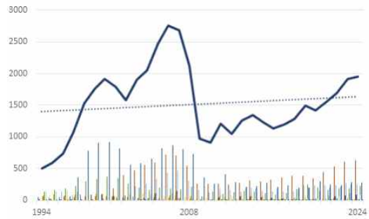
Fig. 1. Piston aircraft market trends, 1994-2024 (GAMA, 2025).

이와 같이 왕복기관(piston engine) 시장의 회복세를 보이는 가운데 글로벌 MRO 시장 역시 동반성장 추